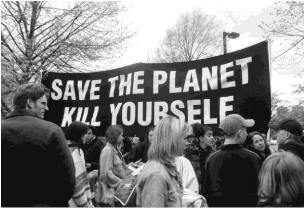
Een banner met het opschrift 'Red de planeet, dood jezelf' op de Dag van de Aarde in 1998. Church of Euthanasia website

Een student schreef: 'Hoewel ik het ermee eens ben dat het bewaren (conserveren) van de biosfeer van groot belang is voor de wereld, denk ik niet dat het verkondigen dat 90 procent van de wereldbevolking moet omkomen door ebola de meest effectieve manier is om bewustzijn voor natuurbehoud te bevorderen.' 3