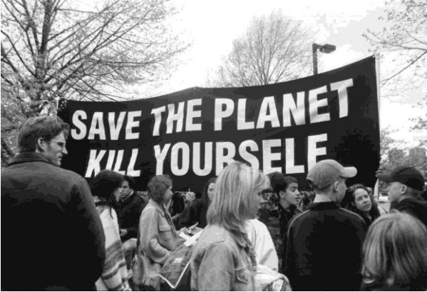
Een banner met het opschrift 'Red de planeet, dood jezelf' op de Dag van de Aarde in 1998. Church of Euthanasia website

Een student schreef: 'Hoewel ik het ermee eens ben dat het bewaren (conserveren) van de biosfeer van groot belang is voor de wereld, denk ik niet dat het verkondigen dat 90 procent van de wereldbevolking moet omkomen door ebola de meest effectieve manier is om bewustzijn voor natuurbehoud te bevorderen.' 3